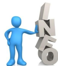
ANNEXE 1 – Taux applicables à compter du 1 er janvier 2019 aux prestations interministérielles d'action sociale à réglementation commune

La circulaire du 26/12/2018 relative aux prestations interministérielles d'action sociale à réglementation commune, précise les taux applicables à compter du 1er janvier 2019 :